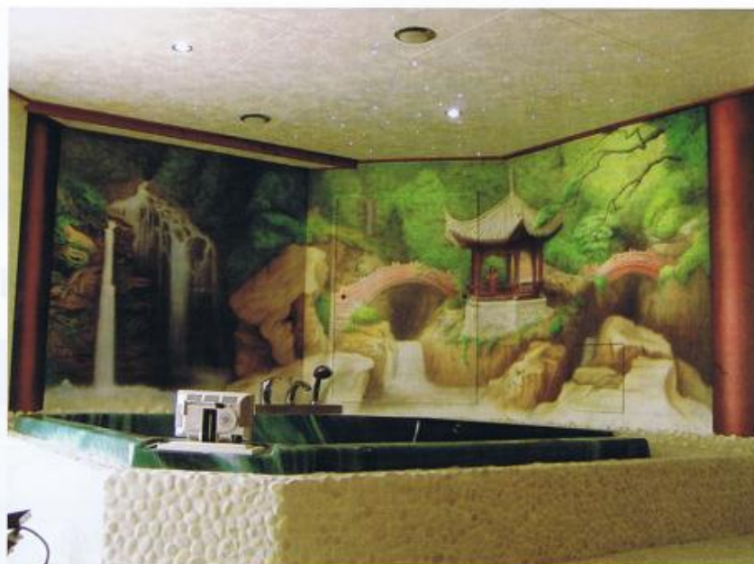
Interieur mvs SARDANA.

waagde ik in mei 2008 de sprong. De naam Atelier Atmosfeertje is gekozen omdat atmosfeer de eenheid van luchtdruk is die ik nodig heb omdat ik voornamelijk met de airbrush werk. Dit is een verfspuitje zo groot als een ballpoint.