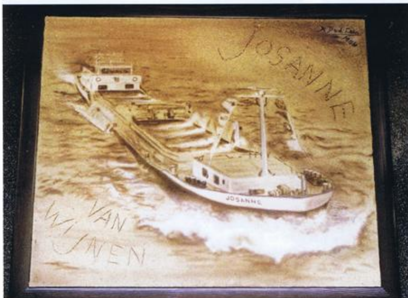
JOSANNE op zand gemaakt.

Omdat ik dacht dat je met teken en schilderen niet je brood kon verdienen besloot ik een technische opleiding te volgen geïnspireerd door mijn oudste broer Jaap die een cursus Radio en TV monteur deed. Later tijdens mijn stage op de MTS werd ik in een donker hol met schema's en versterkers geïmpropt, alleen het het