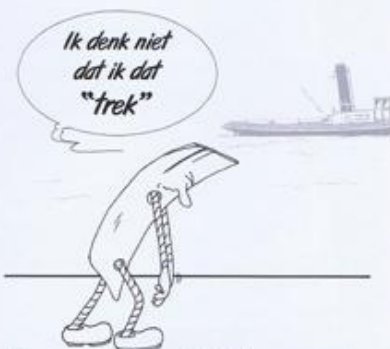
Thema dit jaar de "sleeppvaart".