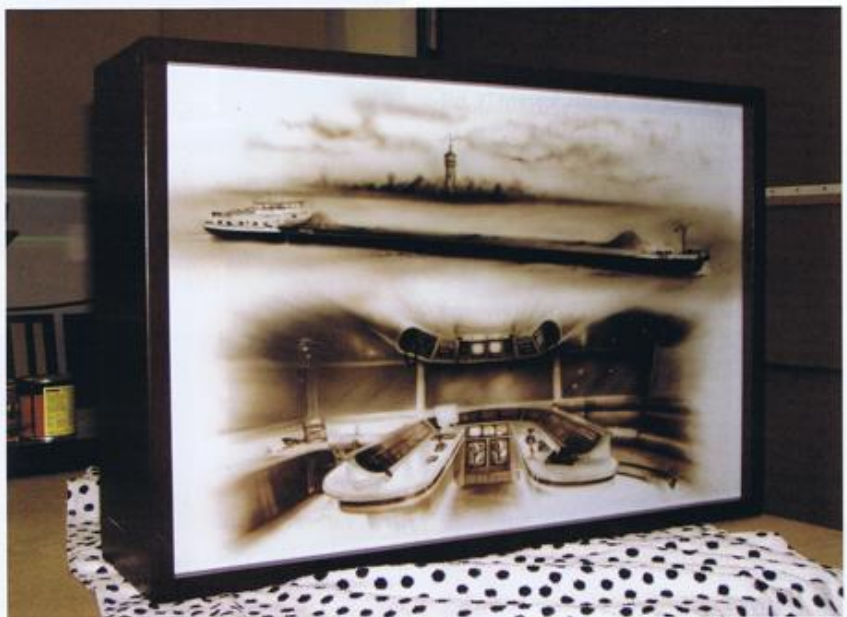
Impressie van het mvs TRIANGLE.

hadden toverde ze altijd wat lekkers op tafel. Dit wat bij ons aan boord bekend als 'Hutse-Flutsie' Maar een gedeelte is ontwikkeld door het jaren lang achter de bank aan boord van de TEUDI III met mijn Smurfen te spelen. Of door met nepbonte stoelhoezen uit sloop auto's om me heen geslagen als een berenvel op jacht te gaan in een landschap van schroot naar draken en beren. Tot we weer gin-